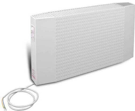
STACJONARNE mocowanie naścienne